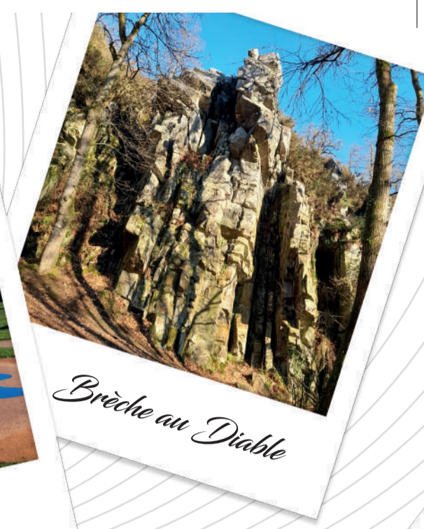
Brèche au Diable