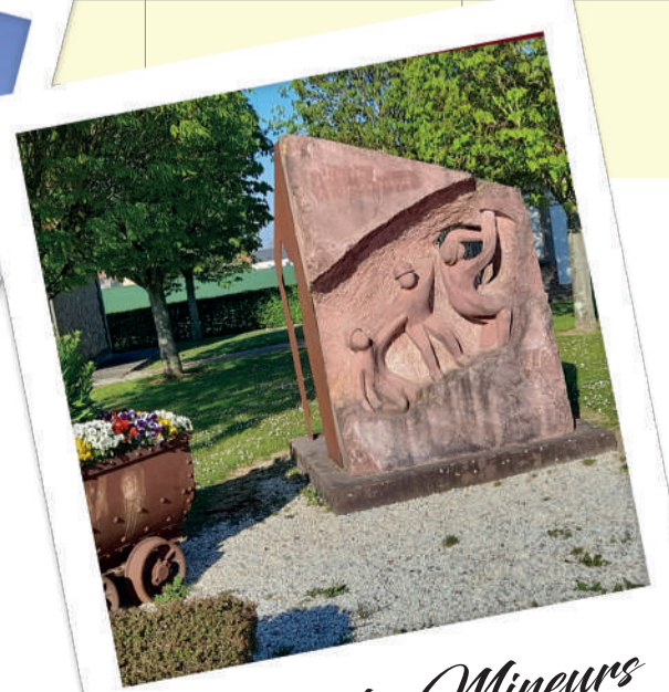
Stèle des Mineurs