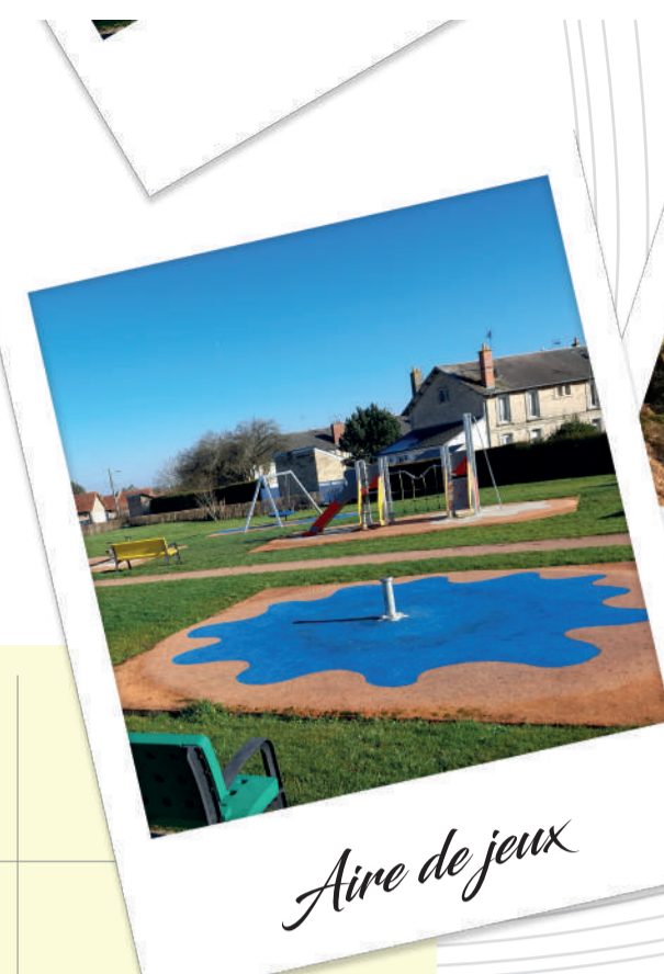
Aire de jeux