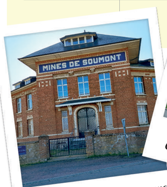
Centre Culturel Intercommunal