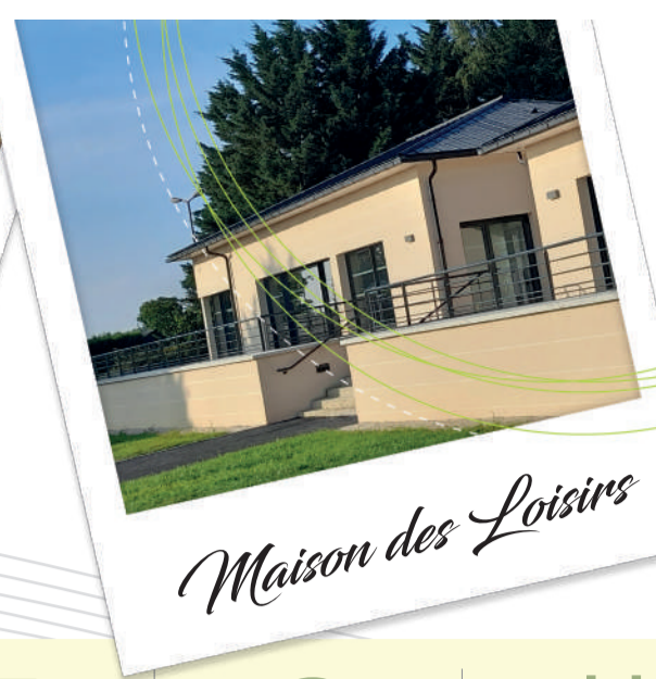
Maison des Loisirs