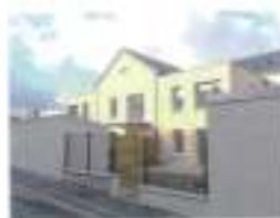
Dernier programme locatif en date, sur la commune : les huit appartements construits par la société Partelios, à l'emplacement de l'ancien magasin SHOPI.

Outre la Mairie, plusieurs bailleurs à vocation sociale proposent également des logements, généralement collectifs, sur Potigny : Le Foyer Normand (49), INOLIA (43) et Partelios Habitat (14).