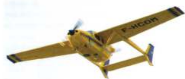
L'avion utilisé par la société Action Air

Ce procédé d'imagerie infrarouge permet d'évaluer les déperditions d'énergie des couvertures et donc les éventuels défauts d'isolation des maisons. Le bimoteur de la société Action Air, retenue pour conduire l'opération, analyse environ 40 km 2 à l'heure, en volant à 750 m d'altitude.