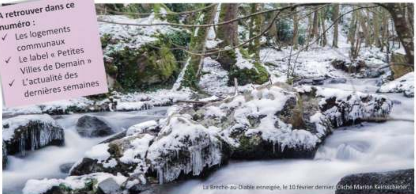
La Brèche-au-Diable enneigée, le 10 février dernier.

A retrouver dans ce numéro : ✓ Les logements communaux ✓ Le label « Petites Villes de Demain » ✓ L'actualité des dernières semaines