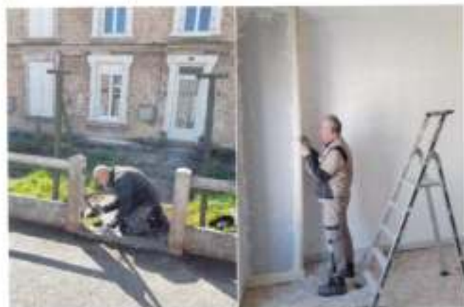
Nos agents interviennent régulièrement dans les logements communaux

Consciente depuis longtemps de l'intérêt architectural et culturel de ce parc, notre collectivité s'est très tôt engagée dans une démarche de sauvetage, par l'acquisition foncière. A la suite de vagues successives d'achats auprès de l'ancien concessionnaire minier, notre municipalité possède aujourd'hui la maîtrise d'une centaine de ces maisons. L'objectif de ce positionnement était d'abord de contrecarrer des opérations spéculatives de grande ampleur sur ce patrimoine et de maintenir dans ces cités les ayants droit du régime minier. En outre, nous avons empêché que ce bâti historique subisse des transformations architecturales malheureuses, qui auraient fini par le dénaturer. Enfin, nous permettons ainsi à des familles modestes, souvent des jeunes couples exclus du marché de l'accession, de se loger grâce à des loyers plus modiques que ceux pratiqués par le secteur privé.