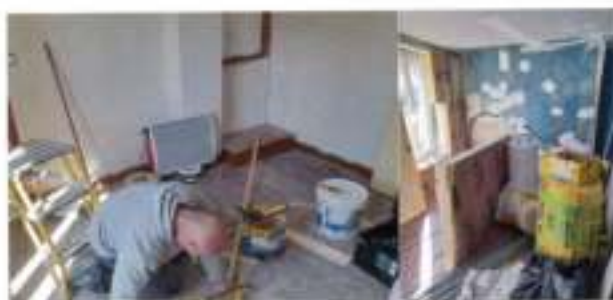
Plusieurs chantiers de réhabilitation sont en cours Rue des Bleuets

Cette action s'accompagne également d'importantes et régulières opérations d'entretien au sein de nos logements, soit en régie (avec nos propres services techniques), soit grâce à l'intervention d'entreprises locales. Ces travaux permanents de réhabilitation, de mise aux normes, d'amélioration des conditions de confort et des performances énergétiques, représentent une enveloppe annuelle d'environ 100 000 euros.