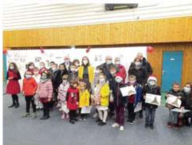
Après la cérémonie, les dessins ont été exposés à la Mairie tout janvier