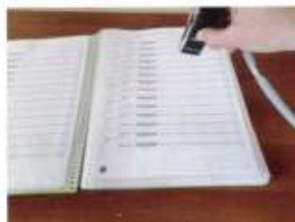
A l'aide d'un scanner portable, chaque présence est pointée par l'agent

En effet, depuis le 1 er février, la réservation des repas scolaires ne passe plus par l'achat préalable de tickets auprès du garde champêtre municipal, mais par un simple mail ou appel auprès d'un service spécifique en mairie. Le paiement des repas s'effectue ensuite à réception d'un avis envoyé par le Trésor Public. Les inscriptions à la garderie et la facturation du service s'effectuent selon les mêmes modalités. Sur place, nos équipes sont équipées de scanners qui permettent de pointer les enfants présents.